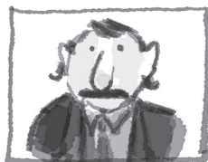
PEPITO SUPER GEHEIME DIENST

'Dat begrijp ik, Super Pablo,' antwoordde Pepito. 'En dat is